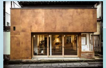
【いしかわインテリアデザイン大賞】 Serif s(セリアス) 2017