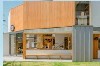
【グッドデザイン賞2017】 Good Job! Center KASHIBA/STUDIO 2016