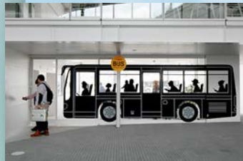
新山口駅北口駅前広場0番線 2018