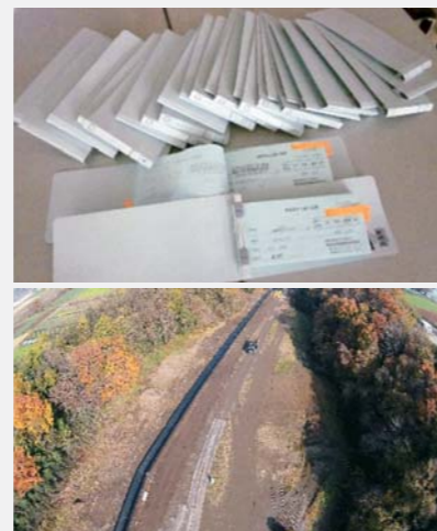
建設発生土処分場（上空より）